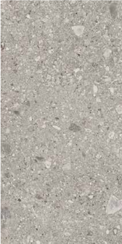
75×150 cm Greige