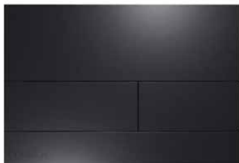
Tece Square II matná černá

závěsné WC 370x560x365 mm, s hlubokým splachováním, bez vnitřního okraje, Bílá Alpin