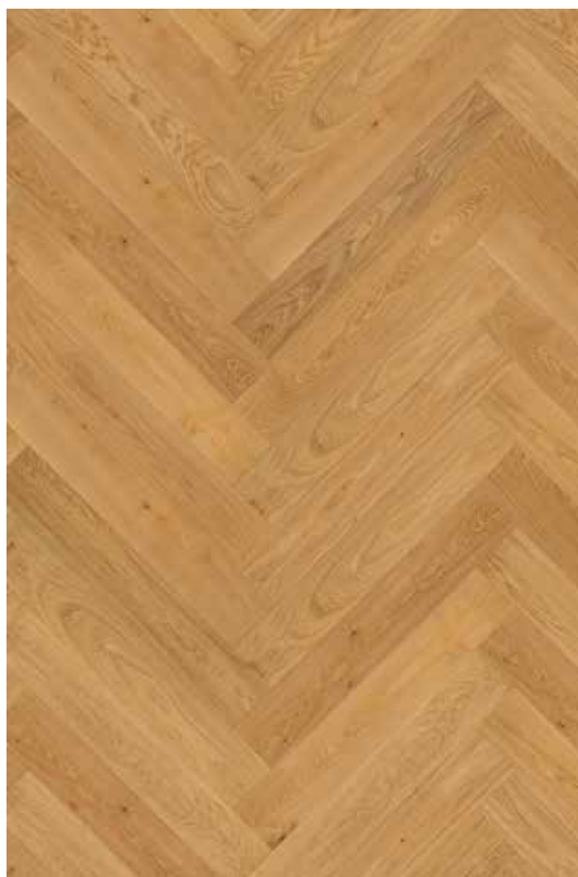
podlaha ESCO Dub Crussol mat lak čisté třídění