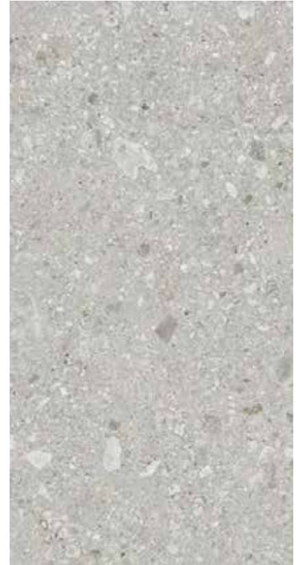
75×150 cm Grey