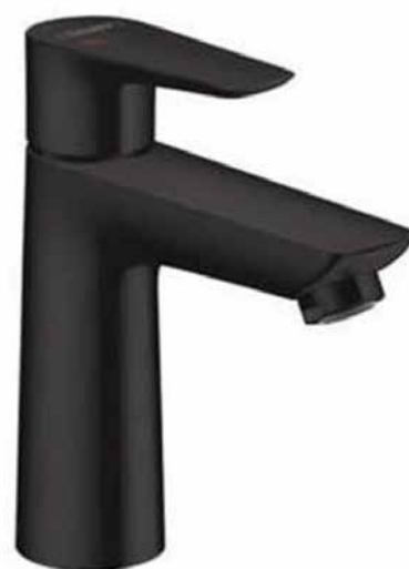
Hansgrohe Talis E černá matná

Značka Grohe slučuje moderní prvky s nadčasovými, tradičními aspekty v podobě produktů, které působí jako by vám byly navrženy na míru.