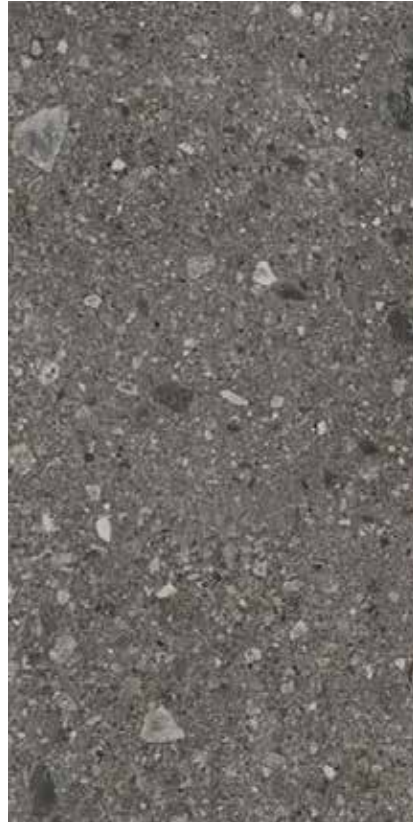
75×150 cm Anthracite