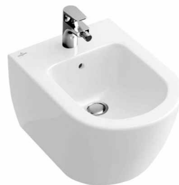
Bidetovací WC TOTO Washlet RW