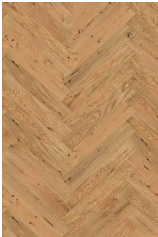
podlaha ESCO Dub Anjony mat lak třídění rustik